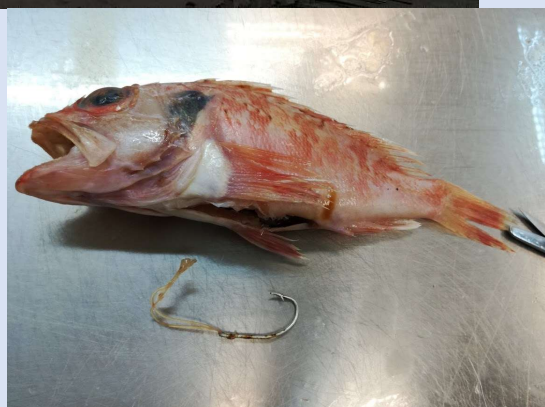
(Inserir fotografias/imagens ilustrativa dos projetos cofinanciados)